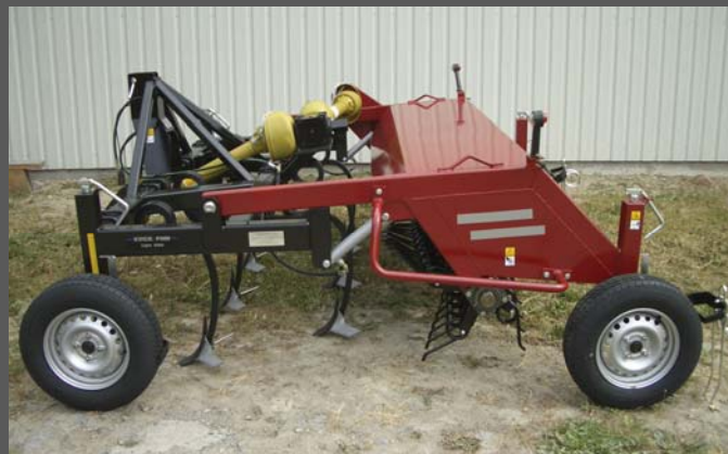
KVICK-FINN ECO S