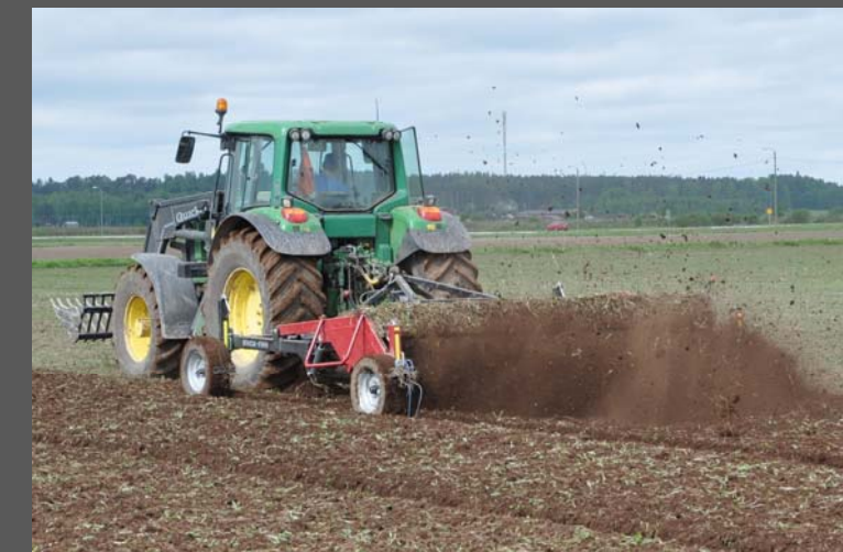
Kvick-Finn Light 3550x3 lors du Luke-Test en Finlande